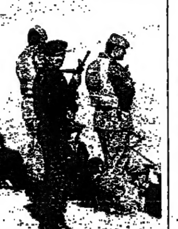
جنود اترك نام سد اتاتورك

اشرف الرئيس التركي توركوت اوزال بعد ظهر امس شخصياً على عملية اطلاق مياه الفرات لمدة شهر الى حتى ١٣ شباط المقبل من اجل ملء سد اتاتورك الذي يبعد ٦٠ كيلومتراً عن الحدود السورية، وكان ان احتجاز مياه الفرات في تركيا ان سبب اي مشكلة مع سوريا والعراق. وقال اوزال في كلمة له القاها وقت سابق ان الامر يتعلق بضرورة تقنية لنسب اى اضرار للول الاخرى الواقعة على ضفاف الفرات لاننا قدما لها في السيلف كمية مياه اكبر من العادة. وفي بغداد، معاويز الزراعة المزارعين الى التقنين في ري اراضيهم. اوربة - (تركيا) - ا ف ب